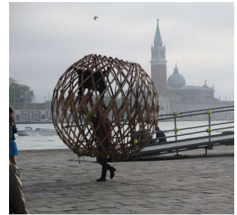
Enkhbold, Mongolie - Biennale Arte 2015